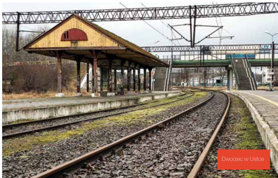
Dworzec w Ustce