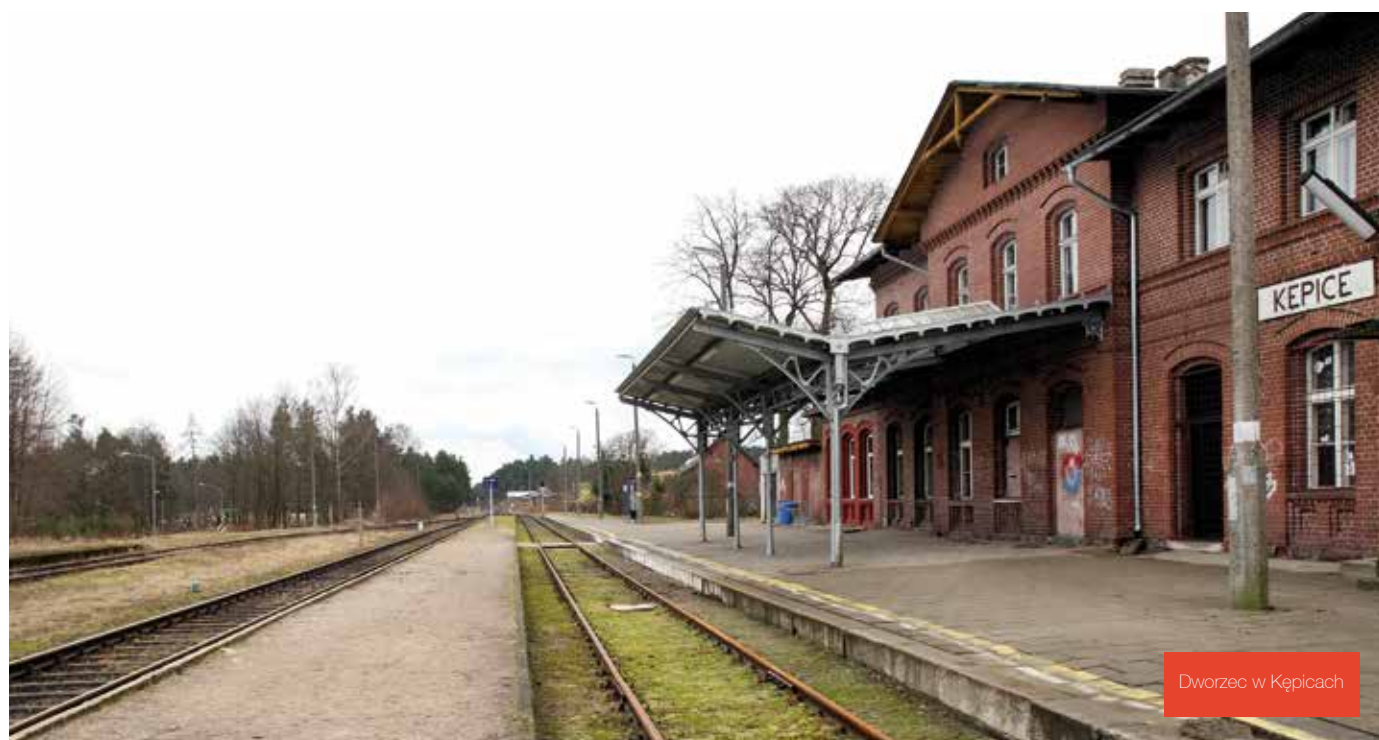
Dworzec w Kępicach