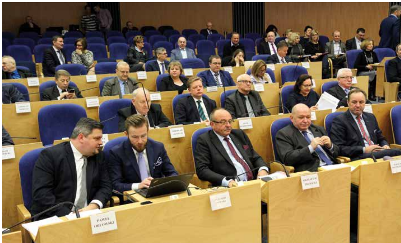
Fot. Sławomir Lewandowski