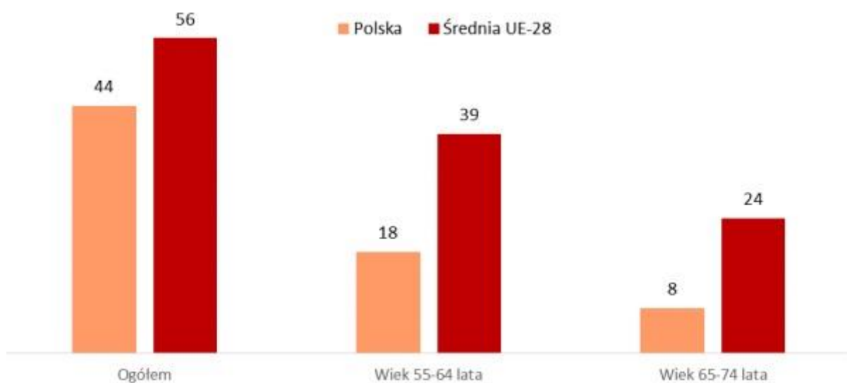
Wykres 3 Osoby posiadające podstawowe lub ponadpodstawowe kompetencje cyfrowe w 2016 r. (w %)