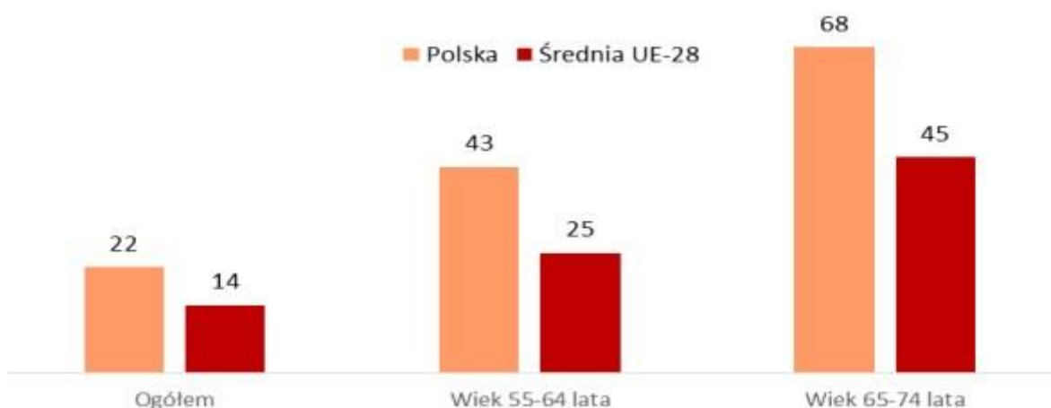
Wykres 2 Osoby niekorzystające z Internetu w 2016 r. (w %)

Należy zwrócić uwagę na duży problem wykluczenia cyfrowego oraz niskich kompetencji cyfrowych w grupie osób starszych. Wśród osób w wieku 55-64 lat mamy w Polsce dwa razy wyższy odsetek niekorzystających z Internetu niż ogółem w kraju, a w populacji w wieku 65-74 lat – trzy razy wyższy. To duży problem, gdyż technologie cyfrowe mogą znacznie poprawić jakość życia osób starszych – pozwolić im na wygodniejsze, ale też tańsze zakupy i płacenie rachunków, szybszy kontakt i uzyskanie pomocy w sprawach zdrowotnych, jak również realizację hobby i zainteresowań oraz utrzymywanie kontaktów towarzyskich. Na to, że sytuacja wśród osób w starszym wieku nie musi być aż tak zła, wskazuje przykład innych państw europejskich, jak chociażby kraje nordyckie. Generalnie, w większości państw UE wymienione odsetki są o 1/3 niższe niż w Polsce.