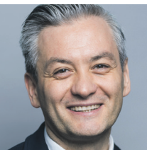
Robert Biedroń Prezydent Słupska

Ś rodki unijne to szansa na gigantyczny skok w rozwoju Słupska. Dotychczas dzięki perspektywie finansowej 2014-2020 nasze miasto pozyskało ok. 190 mln zł na projekty o łącznej wartości ponad 270 mln zł. Co ważne, obejmują one niemal wszystkie dziedziny funkcjonowania miasta i przyczyniają się zarówno do rozwoju społeczno – gospodarczego, jak i do poprawy jakości środowiska i zmniejszenia kosztów utrzymania infrastruktury. Wśród tych ostatnich warto wymienić dwa kompleksowe projekty realizowane w ramach RPO WP 2014-2020 obejmujące efektywność energetyczną, w tym między innymi zmodernizowanie systemów oświetlenia zewnętrznego (modernizacja 3260 punktów