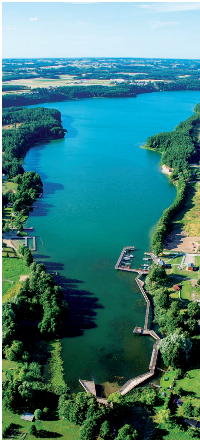
Promenada w Stążęcë