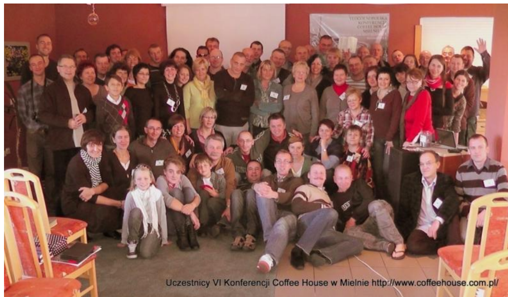
Uczestnicy VI Konferencji Coffee House w Mielnie http://www.coffeehouse.com.pl/