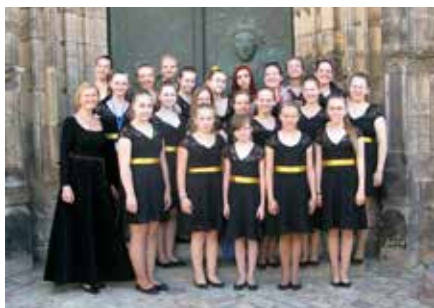
VILNIUS ALGIRDAS MUSIC SCHOOL GIRL'S CHOIR „DIXI” (Wilno / Vilnius, Litwa / Lithuania)