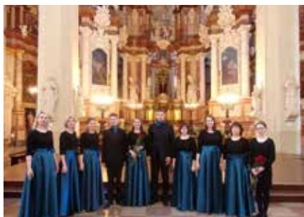
MIXED YOUTH CHOIR „SONG DEO” OF KAUNAS ST. CROSS (CARMELITES) CHURCH (Kowno / Kaunas, Litwa / Lithuania)